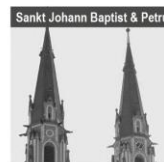
Sankt Johann Baptist & Petrus