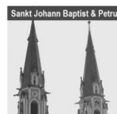
Sankt Johann Baptist & Petrus