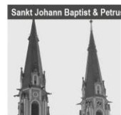
Sankt Johann Baptist & Petrus